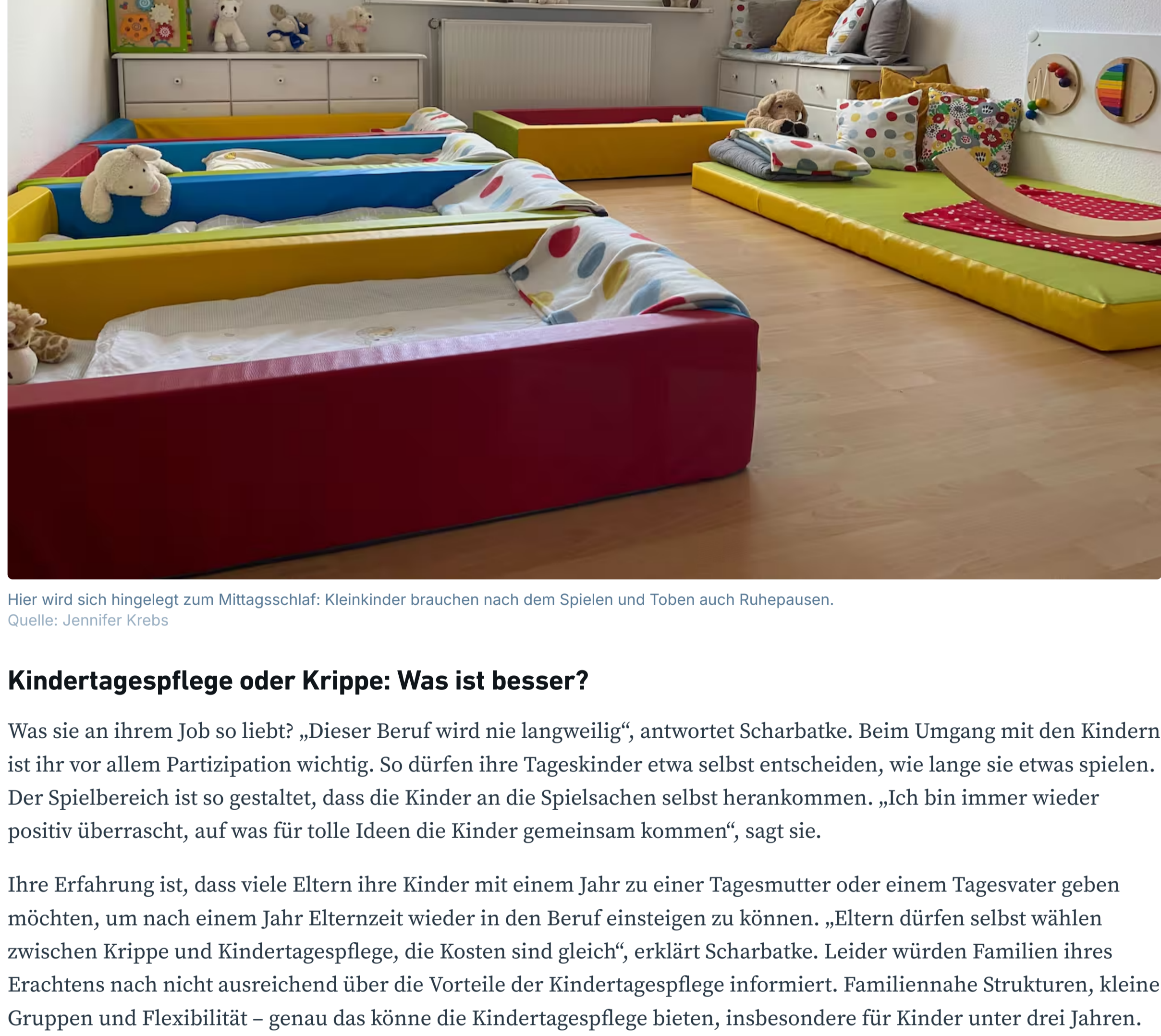
Hier wird sich hingelegt zum Mittagsschlaf: Kleinkinder brauchen nach dem Spielen und Toben auch Ruhepausen.